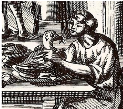
Lebensgroße Gänse verschickte die Firma Niederegger in der Mitte des 19. Jh. an den Zarenhof, der diese als besonders wertvolle Präsente vergab.

Viele abenteuerlichen Geschichten ranken sich um die Entstehung des Marzipans. Thomas Mann kommt mit seiner Bezeichnung diese Schleckerei als Haremskonfekt zu brandmarken wohl am nächsten, denn die Grundstoffe Mandeln, Zucker und Rosenöl sind Produkte des Orient und so auch wohl die Herkunft des Marzipans. Schon über die Namensbildung gibt es viele Versionen. Ist es das venezianische Marcus-brot - Marci Panis -, oder die Verballhornung der byzantinischen Münze - Mauthaban - ? Oder ist ein sizilianisches Schächtelchen für orientalische Süßigkeiten der Ausgang?